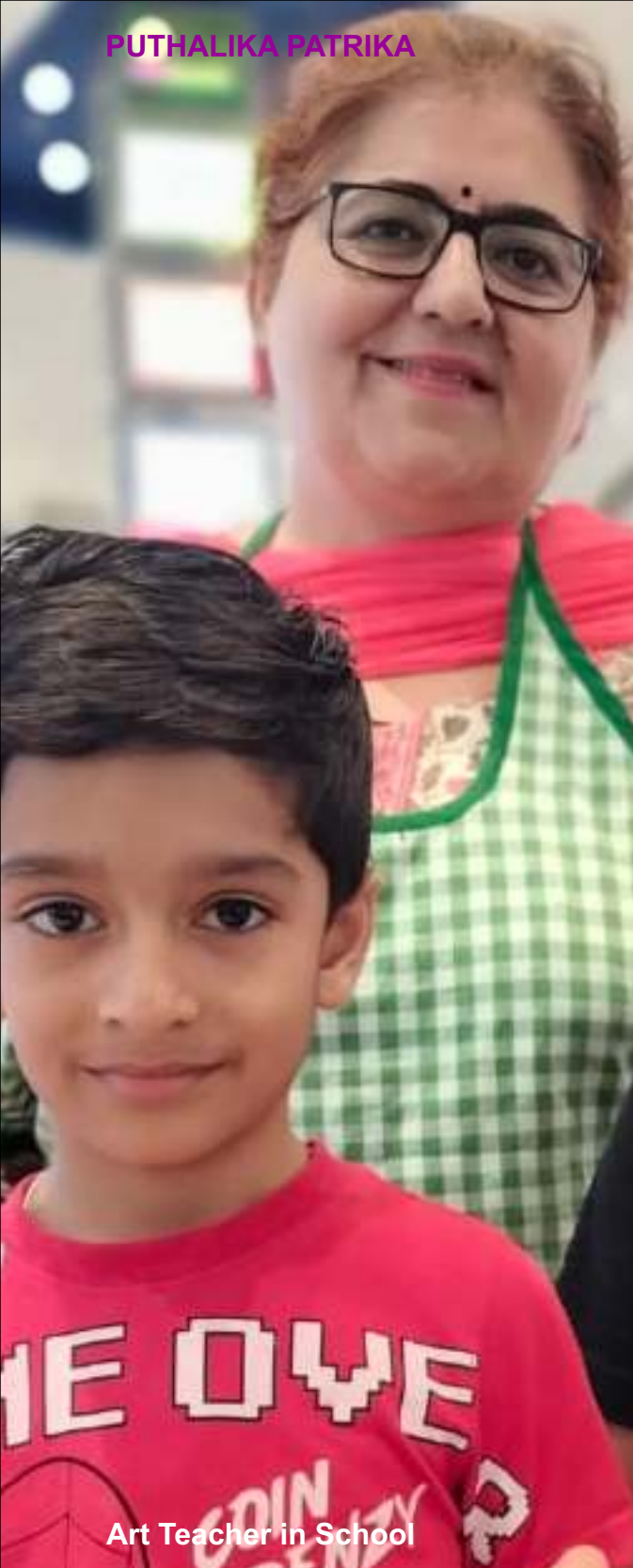
Art Teacher in School